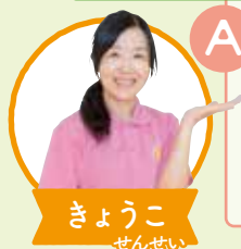
きょうこ せんせい